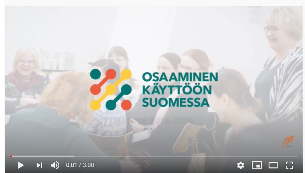
Osaaminen käyttöön Suomessa -hanke 2018-2020